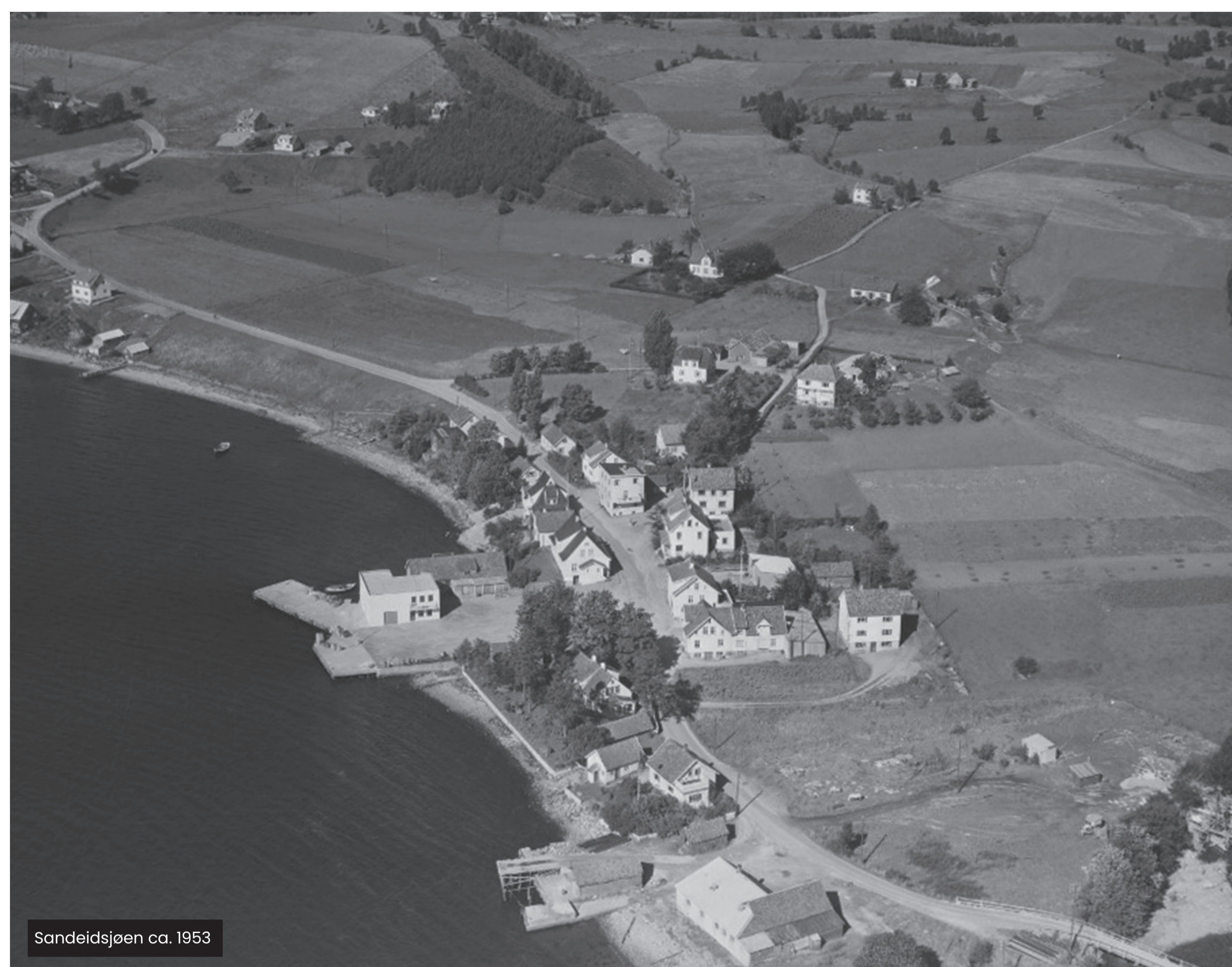
Sandeidsjøen ca. 1953

Sandeid var opphavelig eit jordbruks- og fiskarsamfunn. Sentrum vart i tidlegare tider kalla «Tree», seinare «Sjøen» eller «Sjoargarden». Området utvikla seg til å bli eit handels- og reiseknutepunkt med ulike butikkar, handverkarar, to gjestgiveri, tannlege og lege. I dag er det berre «handelslaget» og «Shell-stasjonen» att som driv vanleg handel.