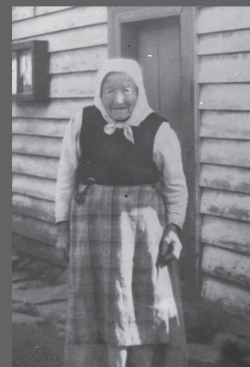
Vindafjordkaien påskeen 1946